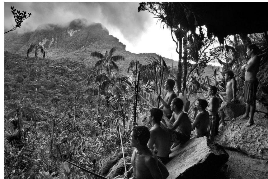
Imagen de Sebastião Salgado

Sin embargo, esta situación no afecta a todas las personas por igual. Hay una serie de factores que determinan la capacidad de acceso a una alimentación adecuada, como la clase social, el género, vivir en la ciudad o no, etc. En la actualidad se da la paradoja de que, disponiendo de una cantidad de alimento suficiente, las personas con menos recursos tienen que basar su alimentación en los productos más económicos, que resultan ser ultraprocesados, lo que revierte en problemas de sobrepeso, malnutrición y obesidad (malnutrición tipo b). Además, no podemos dejar de mencionar la cantidad de desperdicio alimentario y de alimentos que desechamos, mientras que unas personas tiran comida otras no tienen qué comer. Según datos de "Desperdicio alimentario", los hogares españoles desechan semanalmente 25,5 millones de kilos de alimentos.