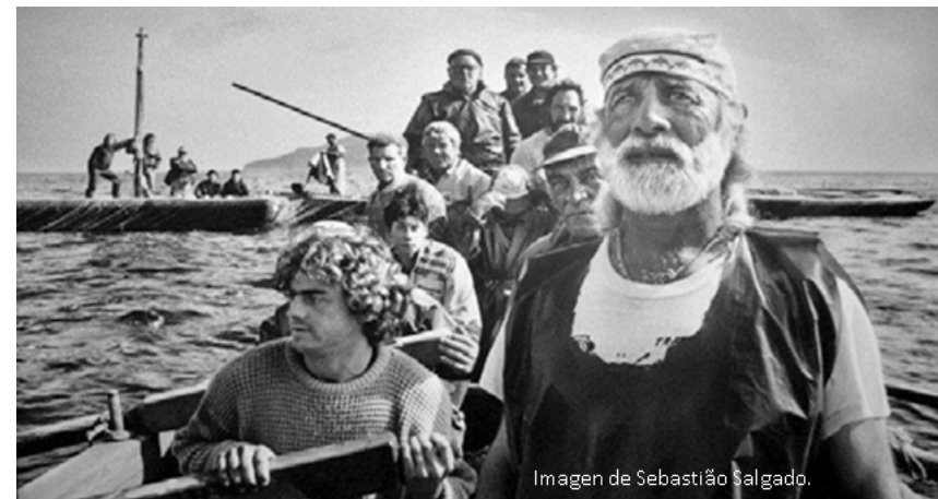
Imagen de Sebastião Salgado.

Dos reflejos de un sistema globalizado que sitúa y ensalza el crecimiento económico, el control de los recursos y las zonas geoestratégicas del planeta en el centro de las agendas, y que priva a las personas y a los ecosistemas de sus derechos más fundamentales para vivir.