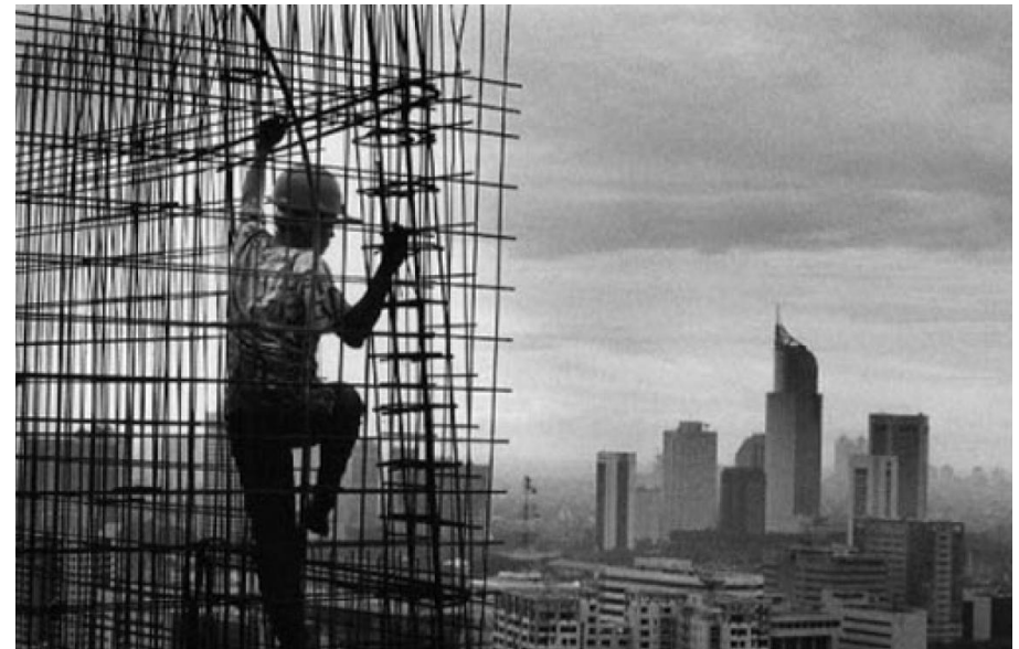
Imagen de Sebastião Salgado

Según el Estudio técnico sobre pobreza energética en la ciudad de Madrid, un 23% de los hogares madrileños se encuentra en riesgo de pobreza energética. Entre ellos, más de la mitad tienen a una mujer como sustentadora principal (la vulnerabilidad de sufrir pobreza energética aumenta significativamente en el caso de los hogares liderados por mujeres, pasando de un 23 a un 32 %) Además, la pandemia del COVID ha agravado esta situación de pobreza energética; según The Conversation, la caída del empleo, la falta de ingresos, y la subida del precio de la energía son algunas razones. Con el confinamiento hemos pasado más tiempo en las casas y, muchas de ellas, no contaban con las condiciones mínimas, mucho menos con el acceso necesario a diferentes suministros.